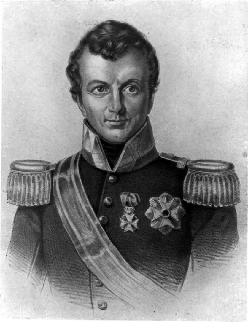
Johannes Graaf van den Bosch